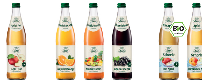
100% Direktsaft 100% Fruchtsäfte Nektar Schorlen