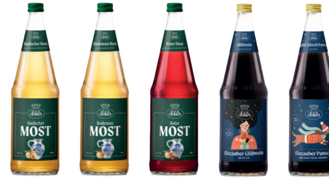
Most, Glühwein und Punsch