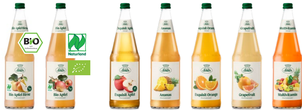
Bio Bio 100% Bio-Direktsäfte