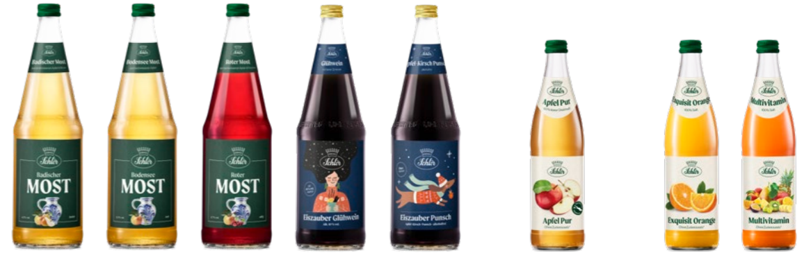
Most, Glühwein und Punsch