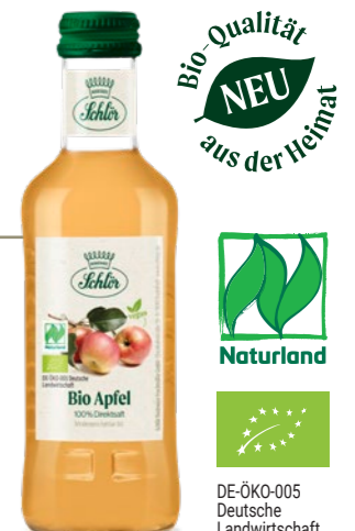
DE-ÖKO-001 Deutsche Landwirtschaft

Schlör Bio-Apfelsaft naturtrüb 0,2l aus Äpfeln heimischer Streuobstwiesen mit kontrollierter NATURLAND-Qualität und DE-ÖKO-001 Deutsche Landwirtschaft